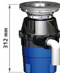
YS-8100(大容量タイプ) 標準生ゴミ 1,000g投入可能 容量:1.5L 自動給水対応型