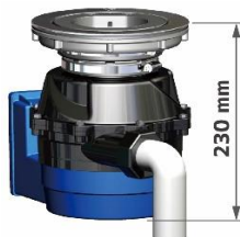
YS-7000L(コンパクトタイプ) 標準生ゴミ 850g投入可能 容量:1.3L