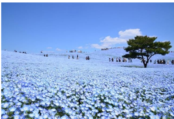
ネモフィラと空と海とが織り成す青のハーモニー