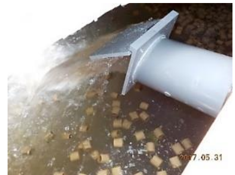
設置例、ポンプ運転時