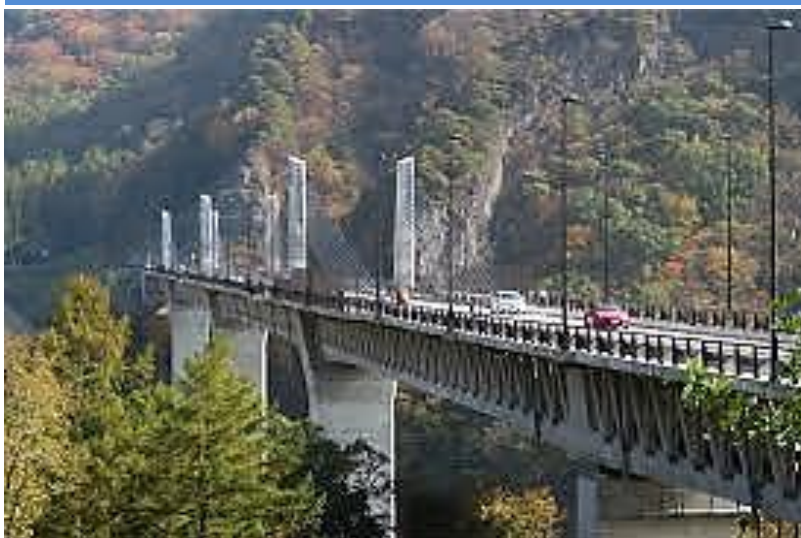
建設中のダムに架かったハッ場大橋